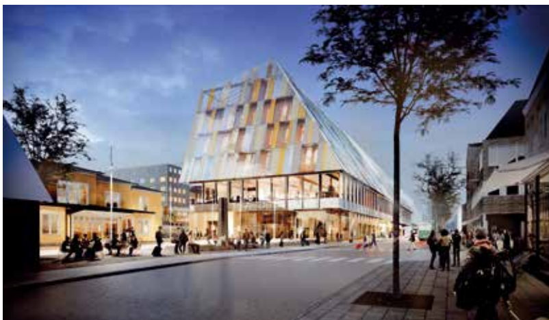
Växjös nya stads- och stationshus.