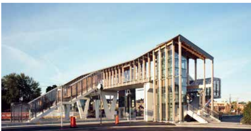
Västerbron på stationsområdet.

Inför bygget av det nya stads- och stationshuset kommer det att byggas en tillfällig station. Den tillfälliga stationen kommer att placeras vid Västerbron mot kyrkogården och innehålla Länsstrafiken Kronobergs kundcenter, vänthall, pressbyrå och uppehållsrum för busschaufförerna. Den tillfälliga stationen kommer att vara klar i april 2018.