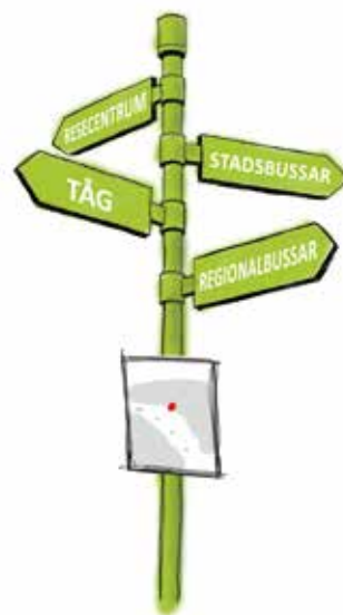
Illustration visar hur skyltning kan se ut.