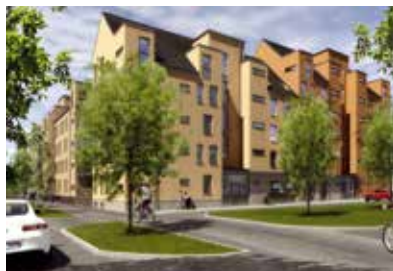
Bostadsrättsförening Lokstallet på södra stationsområdet.

Vi uppmanar alla trafikanter att planera sin resa, vara uppmärksamma och följa skyltning på plats. Arbetet beräknas vara klart våren 2018.